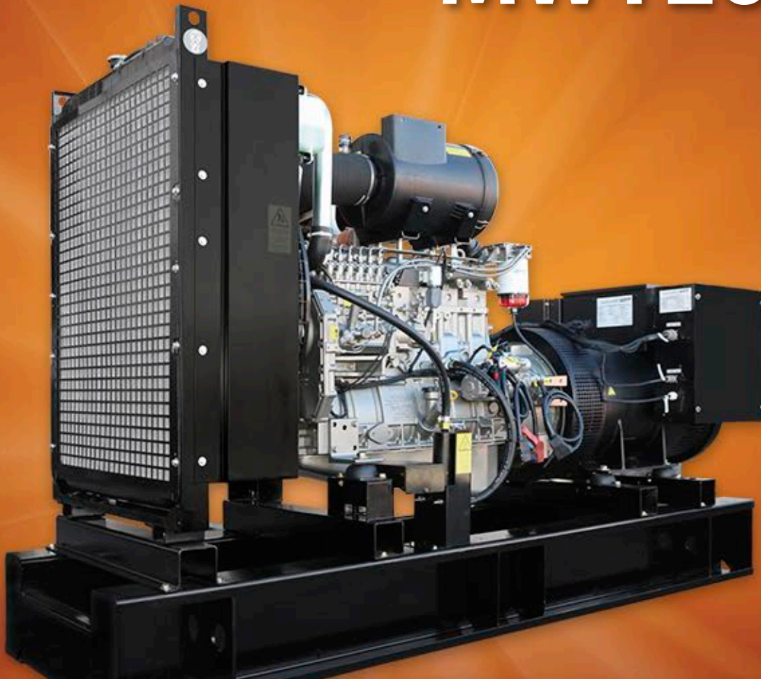
Tabla de Potencias