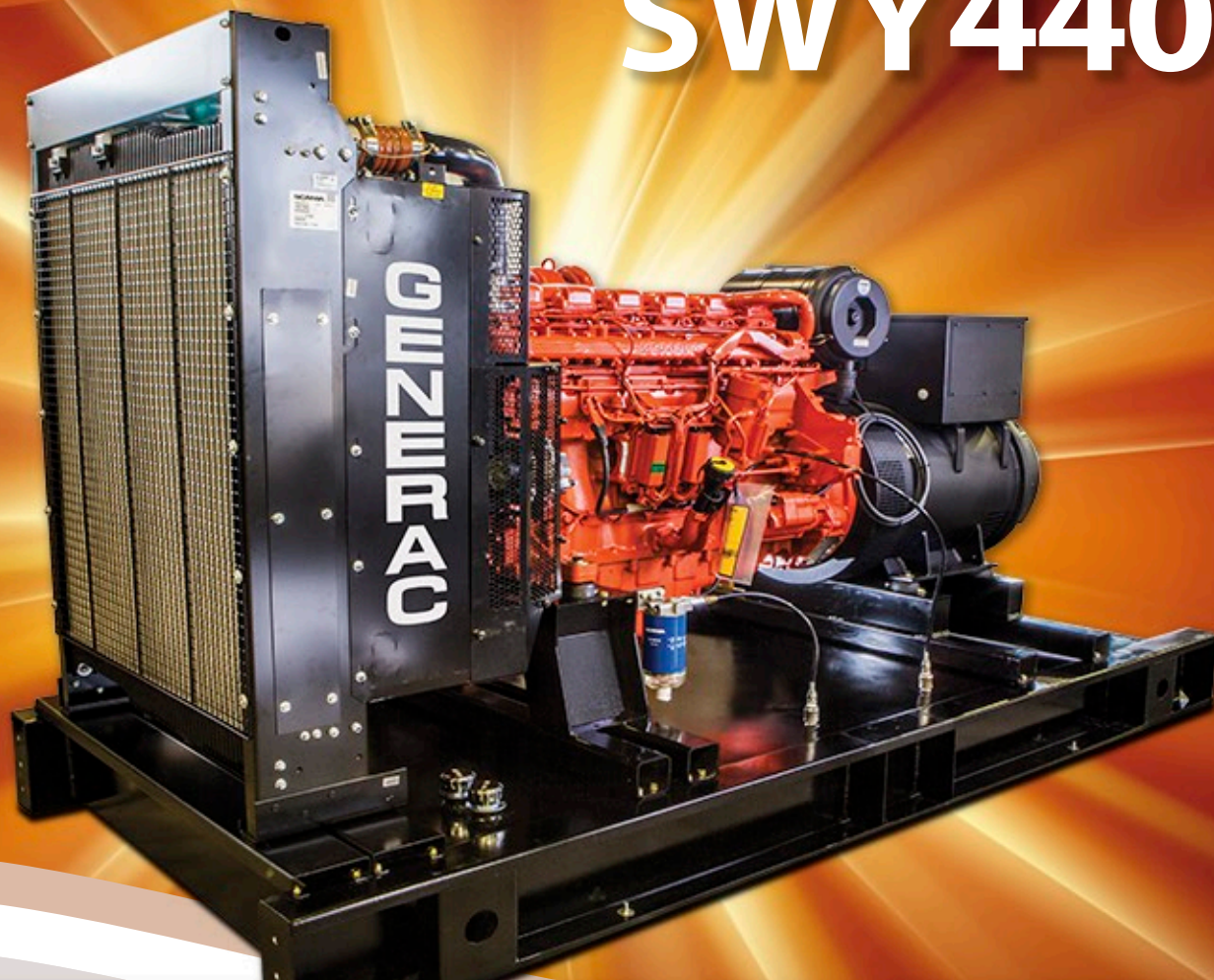
Tabla de Potencias